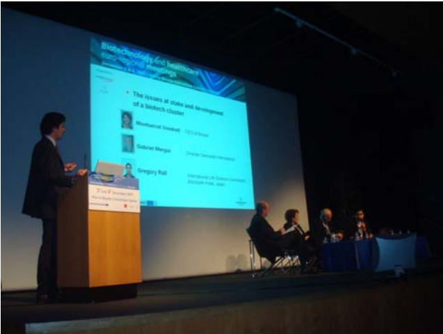
Les Conférences des Rencontres Présentations, échanges d'expériences et débat sur le thème des bioclusters